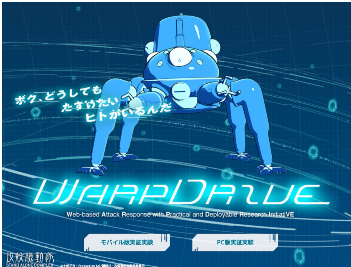
図 1 WarpDrive ポータルサイト ( https://warpdrive-project.jp )

⇒タッチコマ・モバイルのダウンロード ( https://warpdrive-project.jp/mobile-app/ )